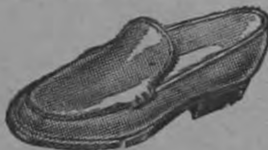
Mocasines para hombre a ₡ 15.-