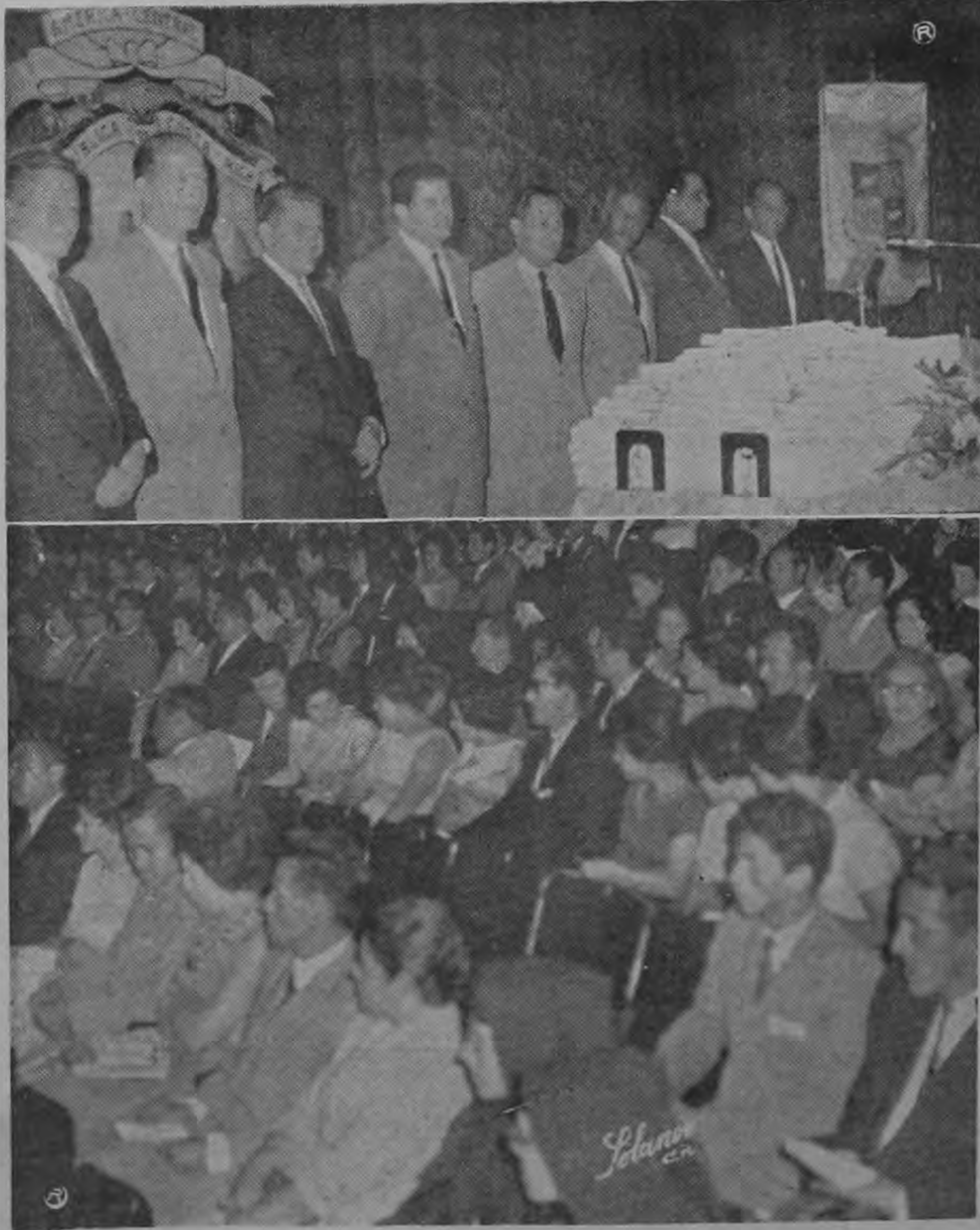
CEREMONIA DEL I. F. P. M. — Dos aspectos del acto de clausura del curso directo del Instituto de Formación Profesional del Magisterio, ayer en el Teatro Raventós, haciéndose entrega del título de maestro normalista a 340 alumnos del Instituto.