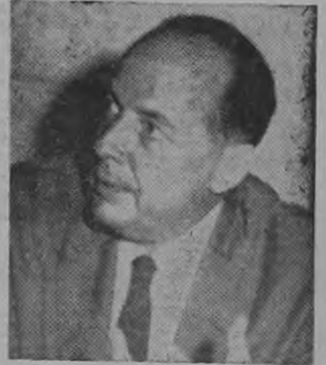
DELESSEPS S. MORRISON: entregó la nota norteamericana en la OEA...