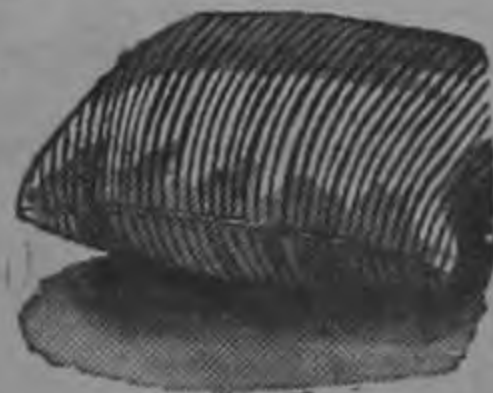
Almohadas a ₡ 4.00