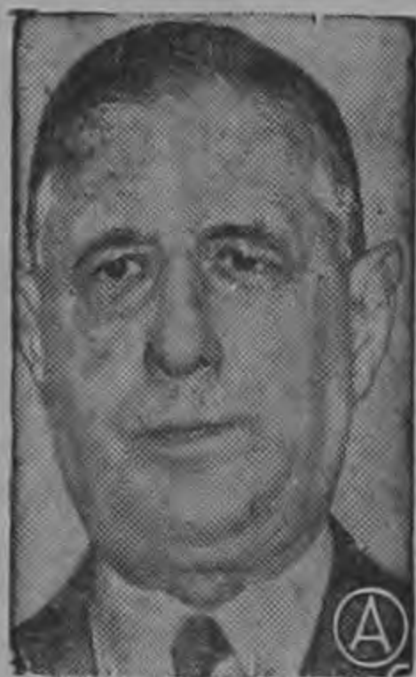
DE GAULLE... hizo fracasar la entrada de Gran Bretaña al Mercado Común.

Expresó que sería mejor acelerar el desarrollo del Nike-X con su cohete más rápido y un sistema de radar más avanzado que concentrarse en el Nike-Zeus, otro proyectil teledirigido contra cohetes de esta categoría. Declaró que el Nike-Zeus "no sería eficaz contra la amenaza más complicada para fines de la década de 1960.