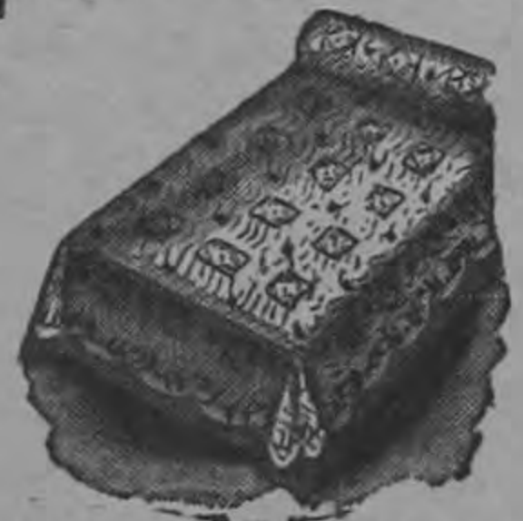
Colchas de rayón a ₡ 20.00