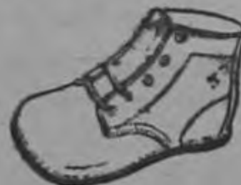
Bebé a ₡ 5.-