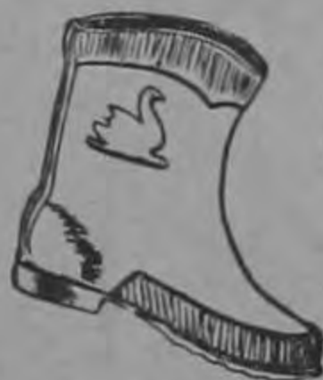
Patito a ₡ 10