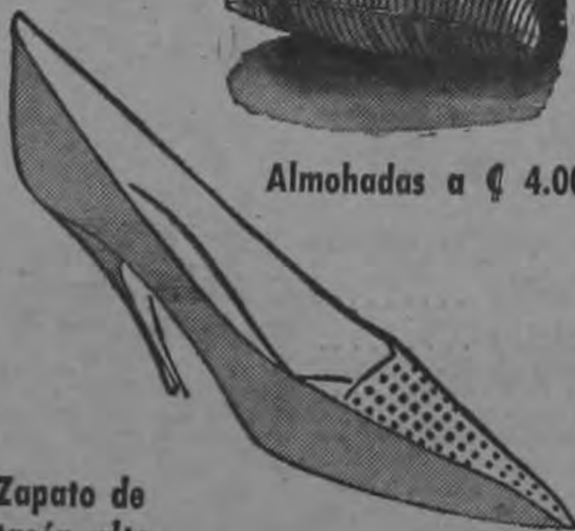
Zapato de tacón alto cosido o clavado . ₡ 29.95