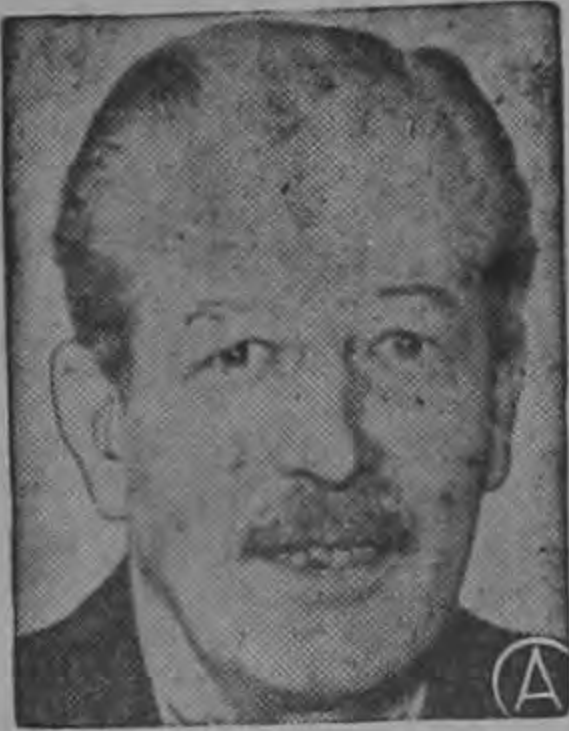
MAC-MILLAN: acusó al gobierno francés de impedir el éxito de sus gestiones...